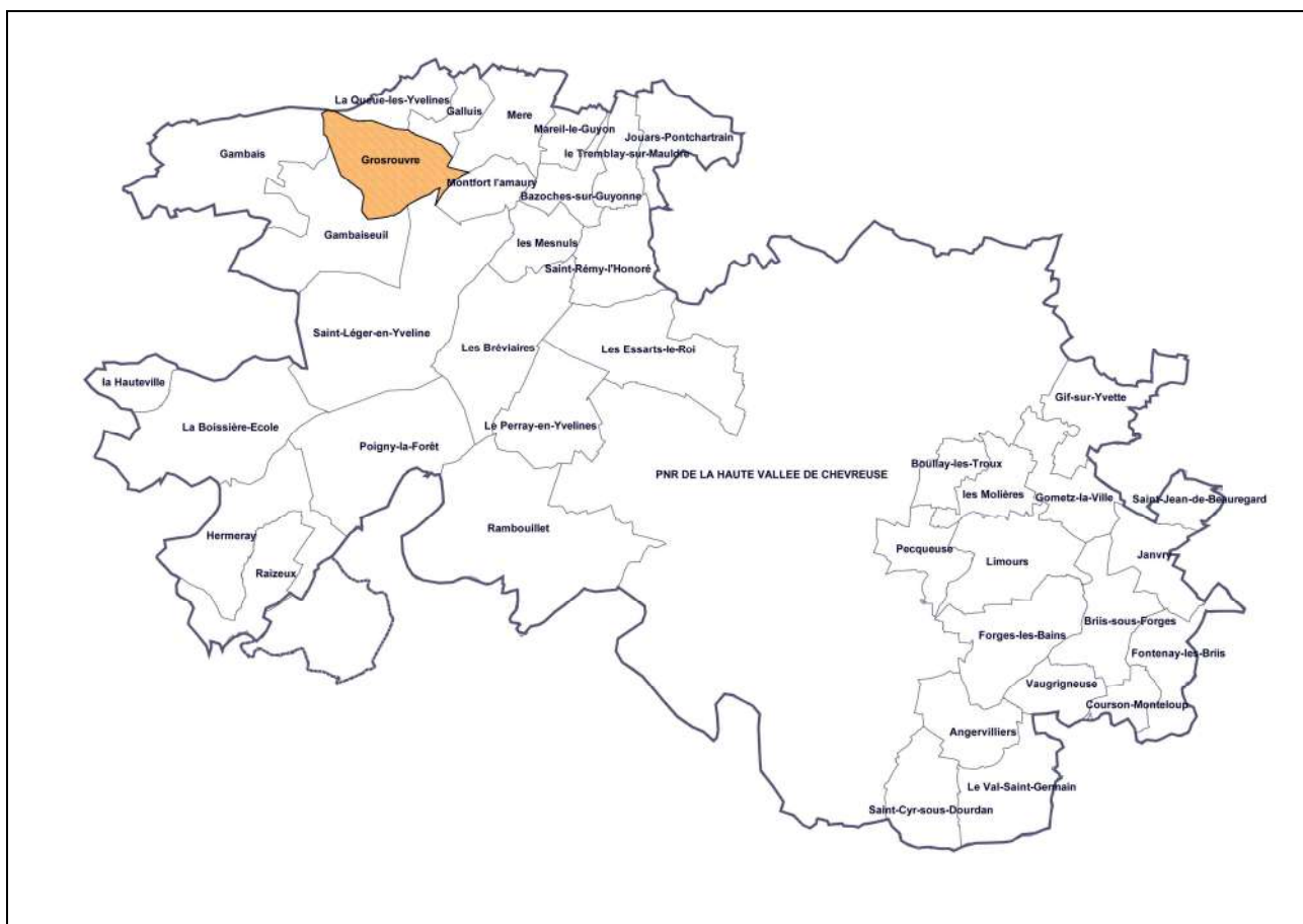
Localisation de Grosrouvre par rapport au PNR et aux autres communes favorables à leur rattachement – Kargo 2008